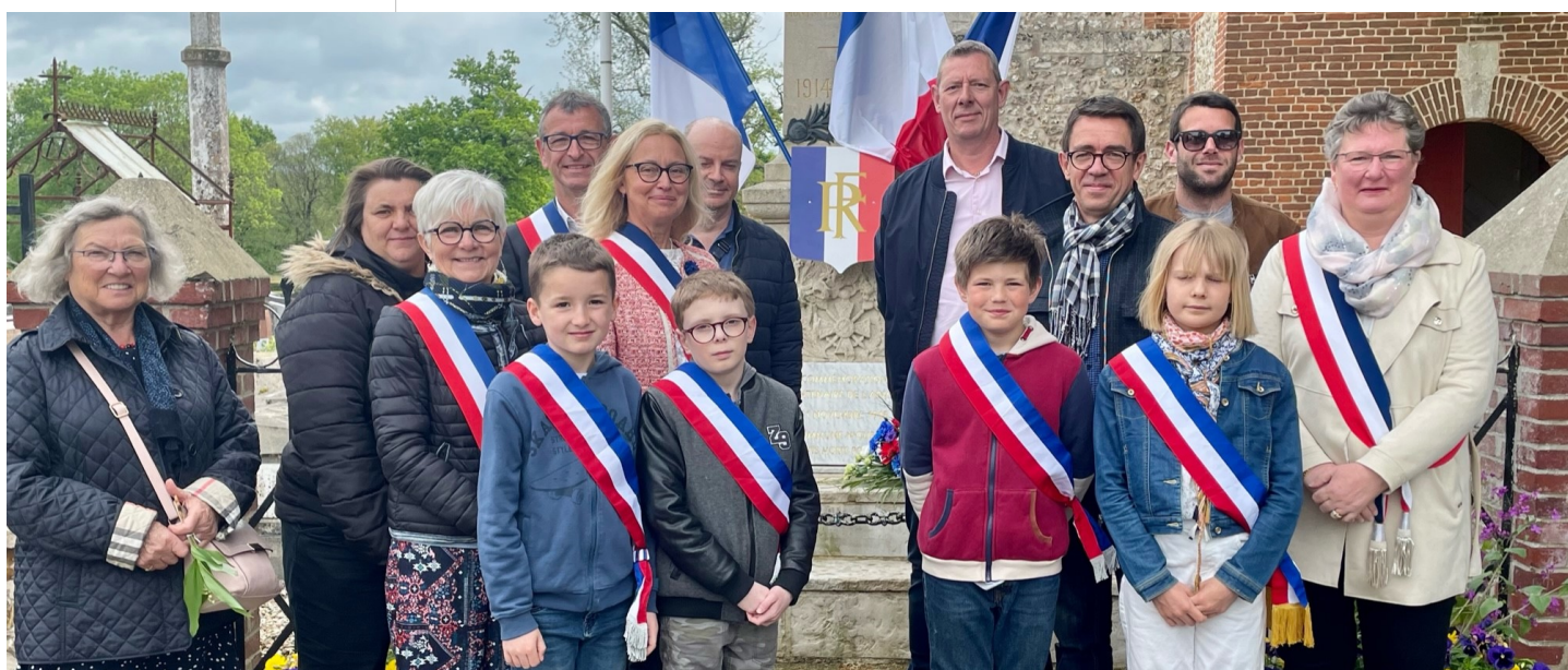
Madame le Maire, ses adjoints, les conseillers municipaux ainsi que le Conseil Municipal des jeunes lors de la commémoration du 78 ème anniversaire de la victoire du 8 mai 1945.